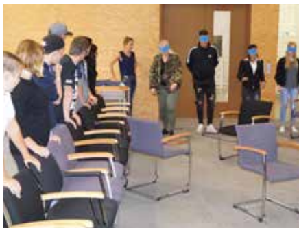
1. Lehrlingsworkshop 2017: Vertraue deinem Team

Rückblick PLETZER Lehrlingsworkshops 2017 - 2021: