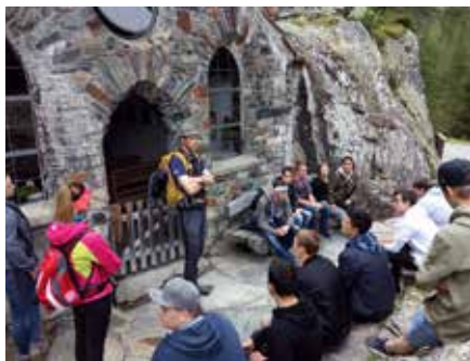
2. Lehrlingsworkshop 2018: Outdoor-Aktivitäten im „Gschlöss“