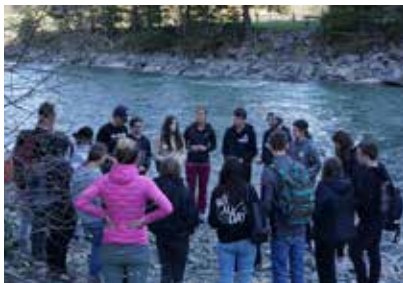
Der Austausch und das Miteinander im Team kamen nicht zu kurz.