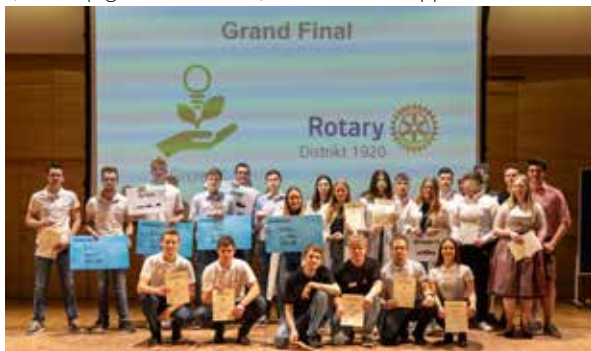
Teilnehmer vom Growin' Projekt