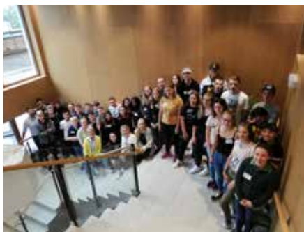
3. Lehrlingsworkshop 2019: Teilnehmer im Das Hohe Salve Sportresort in Hopfgarten i.B.