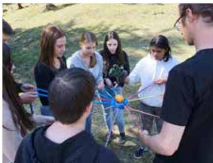
4. Lehrlingsworkshop 2021: Das Geschick der Lehrlinge war gefragt