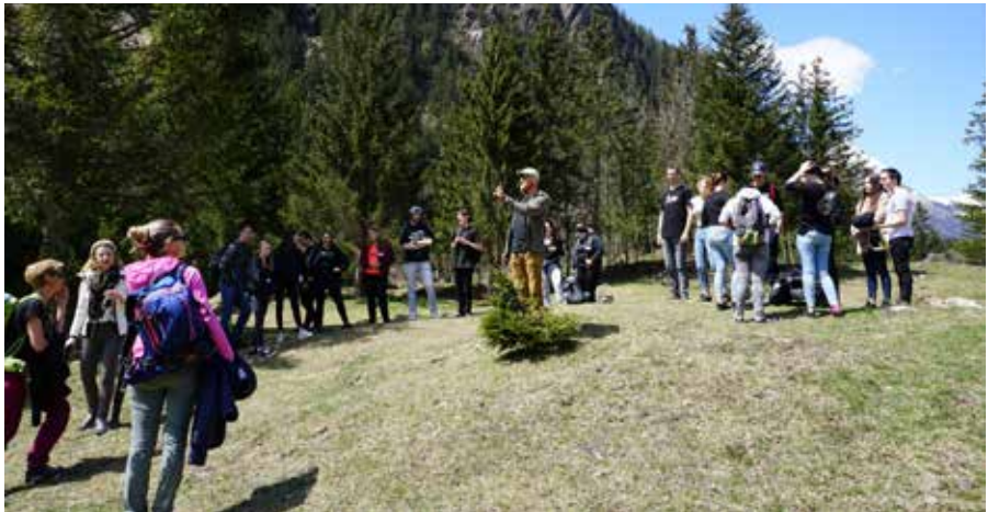
Beim 4. Lehrlingsworkshop konnten die Lehrlinge gemeinsam viele spannende Aufgaben und Herausforderungen lösen.