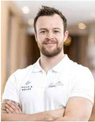
Patrick Koller

„Bewegung, Erholung und Ernährung sind die drei wichtigsten Säulen im Leben und somit auch für das MOVE & RELAX Konzept tragende Pfeiler.“ Patrick Koller